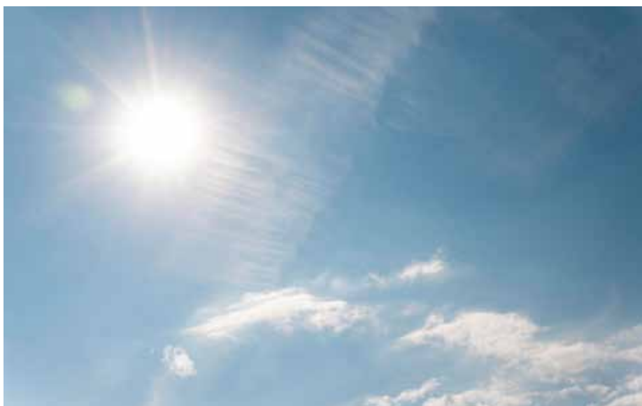
Det europæiske klima ændrer sig med stigende temperaturer, hyppigere og mere intense hedebølger til følge.