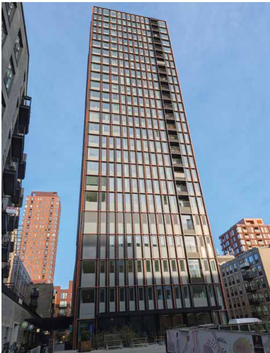
Glas er et vigtigt byggemateriale, der direkte påvirker en bygnings termiske ydeevne. Glasoverflader er de primære grænseflader mellem indendørs og udendørs miljøer og har derfor en dybdegående indvirkning på komfort, dagslystilgængelighed og den samlede energiydelse.